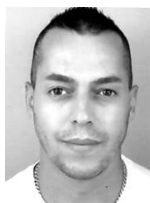
Najim Redzepi geb. 2.5.1978